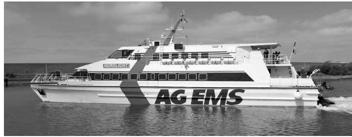
Mit dem Highspeed-Katamaran „Nordlicht“ gelangt man von Mittwoch an bis Mitte September schneller und zu anderen Zeiten von Büsum nach Helgoland

Ab Mittwoch gibt es neben der traditionellen Schiffsverbindung eine weitere Alternative, um nach Helgoland zu kommen: Zwei Mal in der Woche nimmt der Highspeed-Katamaran „Nordlicht“ Kurs auf die Insel. Das schnelle Zweirumpfschiff spart nicht nur eine gute Stunde Fahrzeit; es ermöglicht auch, zu anderen Zeiten auf die Insel zu kommen: Wer die Fahrt am Mittwoch um 12:30 Uhr bucht, ist gegen 14:00 Uhr da und kann, wenn die